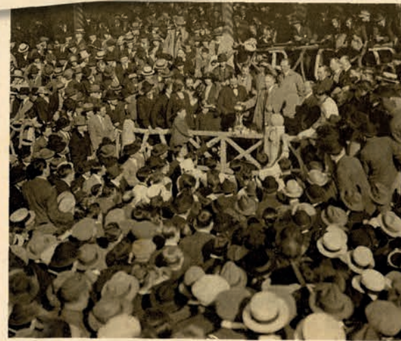
La remise de la Coupe aux équipiers vainqueur